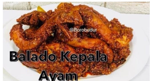
Balado Kepala Ayam