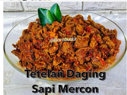
Tetelan Daging Sapi Mercon