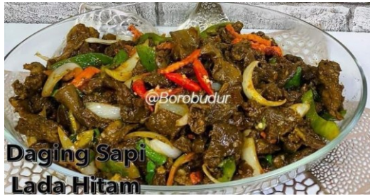
Daging Sapi Lada Hitam