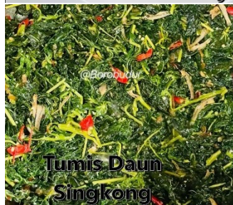
Tumis Daun Singkong