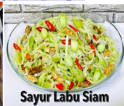
Sayur Labu Siam