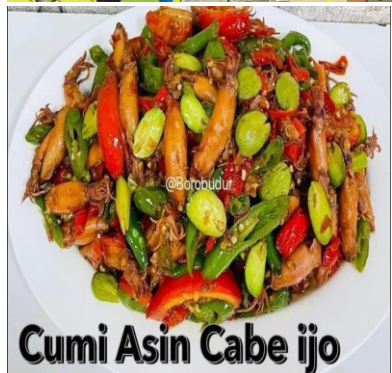
Cumi Asin Cabe Ijo