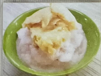
Es Tape 50 樹薯香蘭冰 50