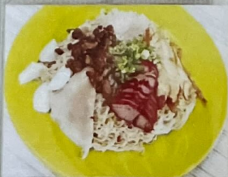
Bakmie 80 乾麵 80