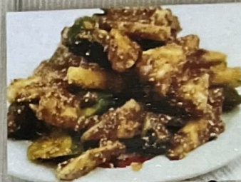
Rujak Buah 70 涼拌水果 70