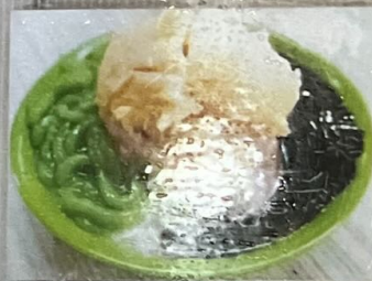
Es Campur 50 綜合香蘭冰 50