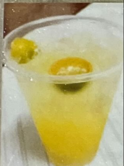
Es Jeruk 30 金桔冰 30