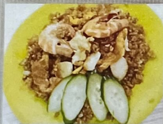
Nasi Goreng 80 炒飯 80