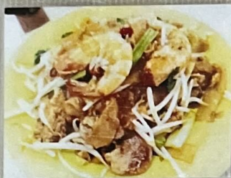
Kwetiau Goreng 80 炒板條 80