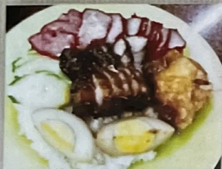
Nasi Campur 100 叉燒飯 100