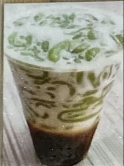
Es Cendo 150 香蘭珍多冰 50