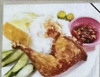
Pecel Ayam 120 雞腿飯 120