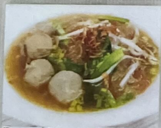
Baso Sapi 100 牛肉貢丸 100